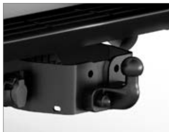
PEREMRE RÖGZÍTETT VONÓHOROG