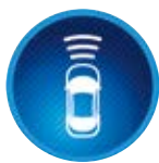
Ütközés előtti rendszer (PCS)

Egy radaros rendszer kamerák segítségével ellenőrzi, hogy a jármű előtti útszakaszon található-e más jármű vagy gyalogos. Amennyiben a rendszer egy ütközés kockázatát észleli, látható és hallható eszközökkel figyelmezteti a vezetőt, és egyben felkészíti a fékeket is a beavatkozásra.