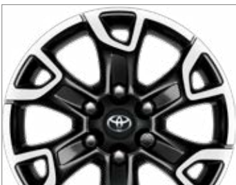
18" FEKETE, CSISZOLT HATÁSÚ KÖNNYŰFÉM KERÉKTÁRCSÁK