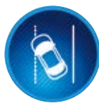
Sávelhagyásra figyelmeztető rendszer kormányrásegítéssel (LDA)

Egy radaros rendszer kamerák segítségével ellenőrzi, hogy a jármű előtti útszakaszon található-e más jármű vagy gyalogos. Amennyiben a rendszer egy ütközés kockázatát észleli, látható és hallható eszközökkel figyelmezteti a vezetőt, és egyben felkészíti a fékeket is a beavatkozásra.