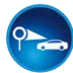
Jelzőtábla felismerőrendszer (RSA)

Egy kamera közreműködésével a rendszer figyeli a forgalmi sávokat elválasztó vonalakat, és audiovizuális jelekkel figyelmezteti a vezetőt, ha azt észleli, hogy a jármű az irányjelző működtetése nélkül készül elhagyni a sávot.